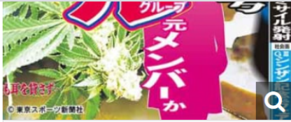
昨日発行の本紙紙面

その誰もがこれまで築き上げた地位を軒並み失っている。これを他山の石として、いまだ薬物に手を染めている芸能人もやめればいいのだが…。それでも「自分だけは大丈夫」としてしまうのが薬物中毒者の特徴だ。