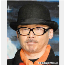
田代まさし容疑者

2019年も残り2か月を切ったが、今年もピエール瀧をはじめ多くの芸能人が薬物で逮捕される事件が起きた。だが、まだまだ終わらない。厚生労働省麻薬取締部（通称・マトリ）は、今後も有名人の逮捕に力を入れる方針だという。そうしたなか、本紙は“極秘内偵リスト”に挙がった3人の名前を入手。果たしてそこに名前が記されているのは誰なのか――。