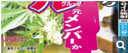
昨日発行の本紙紙面

その誰もがこれまで築き上げた地位を軒並み失っている。これを他山の石として、いまだ薬物に手を染めている芸能人もやめればいいのだが…。それでも「自分だけは大丈夫」としてしまうのが薬物中毒者の特徴だ。