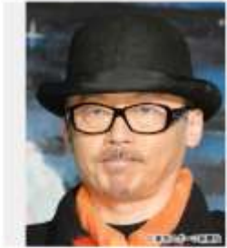
田代まさし容疑者

2019年も残り2か月を切ったが、今年もピエール瀧をはじめ多くの芸能人が薬物で逮捕される事件が起きた。だが、まだまだ終わらない。厚生労働省麻薬取締部（通称・マトリ）は、今後も有名人の逮捕に力を入れる方針だという。そうしたなか、本紙は“極秘内偵リスト”に挙がった3人の名前を入手。果たしてそこに名前が記されているのは誰なのか――。