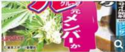
昨日発行の本紙紙面

その誰もがこれまで築き上げた地位を軒並み失っている。これを他山の石として、いまだ薬物に手を染めている芸能人もやめればいいのだが…。それでも「自分だけは大丈夫」としてしまうのが薬物中毒者の特徴だ。