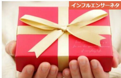
インフルエンサーネタ