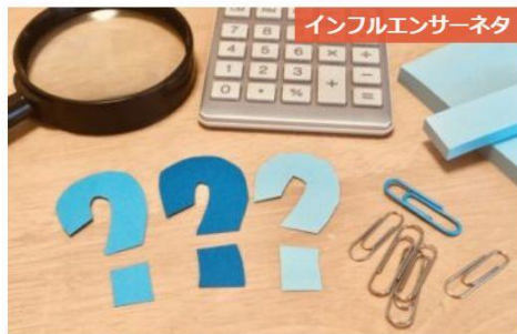
インフルエンサーネタ